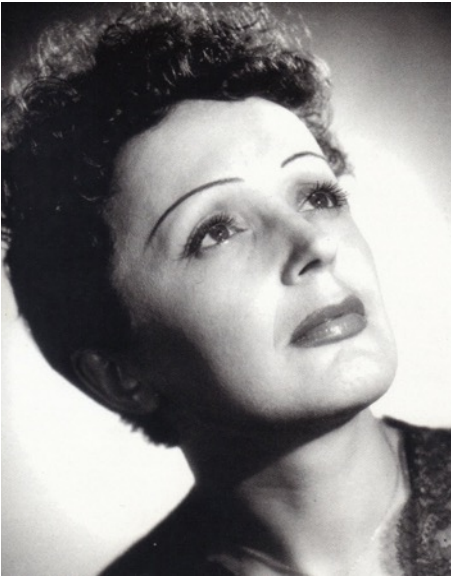
Edith Piaf—“La Môme”